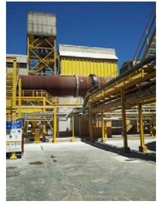
OPTIWAVE 6400C EN SILO CAL 80m