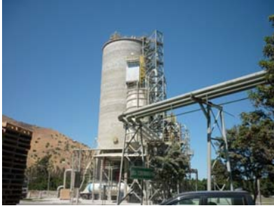
OPTIWAVE 6400 EN SILO CEMENTO 30m