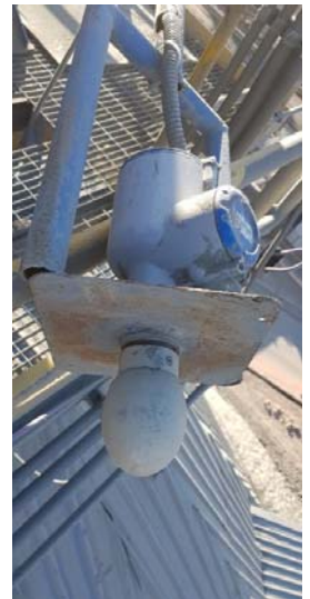
MONTAJE TRANSMISOR DE NIVEL OPTIWAVE 6400 STOCK PILE EN CHILE ALTURA 35 m

NOTA: Para mayor explicación de la operación del Radar FM CW 6400, consultar Infotec 100401