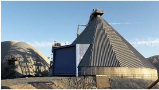
OPTIWAVE 6400 EN STOCK PILE MINERAL