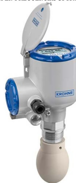
6400 ANTENA DROP