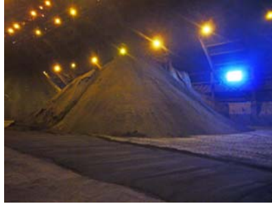
ALMACENAMIENTO DE CONCENTRADO DE COBRE PUERTO EMBARQUE