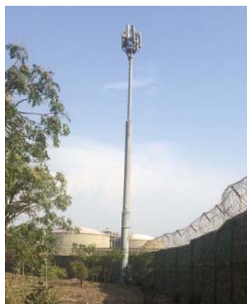
ILUMINACION, DIRECCIONADA SEGÚN DETECCION DEL PRAETORIAN