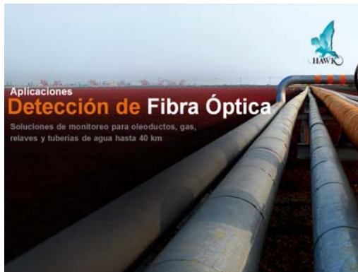
DETECCION DE FUGAS EN ACUEDUCTOS, MINERODUCTOS