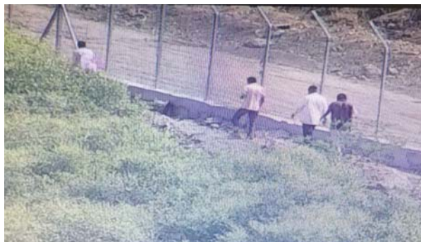
DETECCION DE INSTRUSOS, ROBOS, OTROS