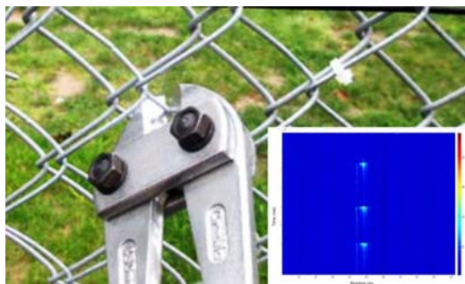
CORTE PROTECCION PERIMETRAL